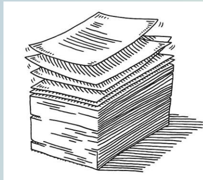
Vente de programmes